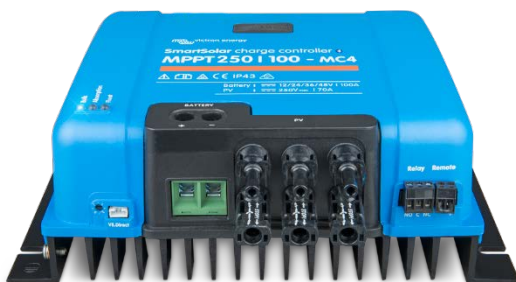
SmartSolar-Laderegler MPPT 250/100-MC4 ohne Display