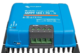
Solar-Laderegler MPPT 150/70-Tr