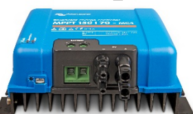
Solar-Laderegler MPPT 150/70-MC4