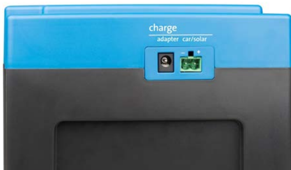
Adapter und Eingang Fahrzeug/Solarmodul (Car/Solar) (Buchse für den Car/Solar-Eingang wird mitgeliefert)