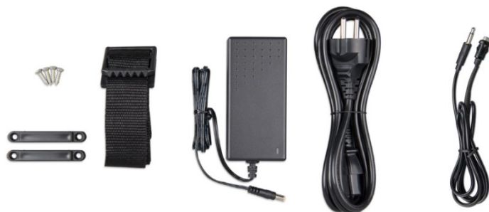
Befestigungsriemen Adapter Stromkabel Druckknopf mit Kabel (2 m) und zweifarbiger LED