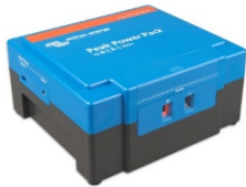
12,8 V, 8 Ah