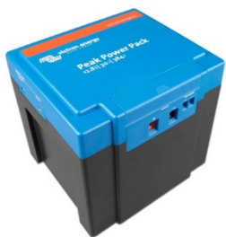
12,8 V, 30 Ah