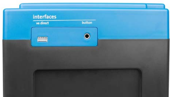
VE.Direct und Druckknopf