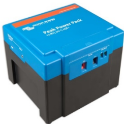
12,8 V, 20 Ah