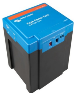
12,8 V, 40 Ah